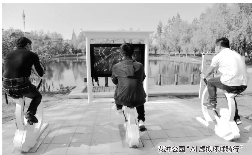
花冲公园“AI虚拟环球骑行”

4月17日,合肥市建设部门发布了该市多座公园的最新消息。其中,合肥首个智慧运动乐享园已正式亮相,庐州公园(庐阳区段)西区、四里渠东路公园、南淝河右岸码头公园等将于今年上半年陆续完工投用。另外,备受期待的园博园也有望在今年国庆前揭开盖头。