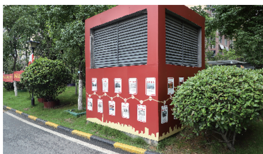
在小区积极打造红色文化阵地