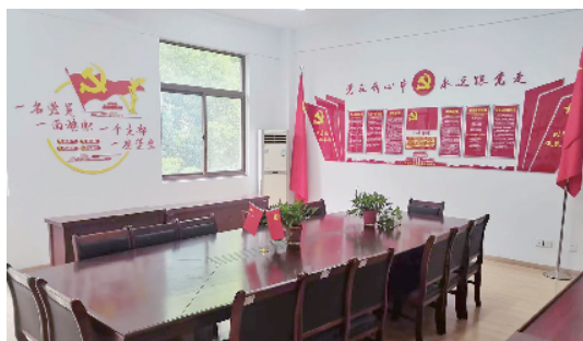
在小区建立红色物业调解室