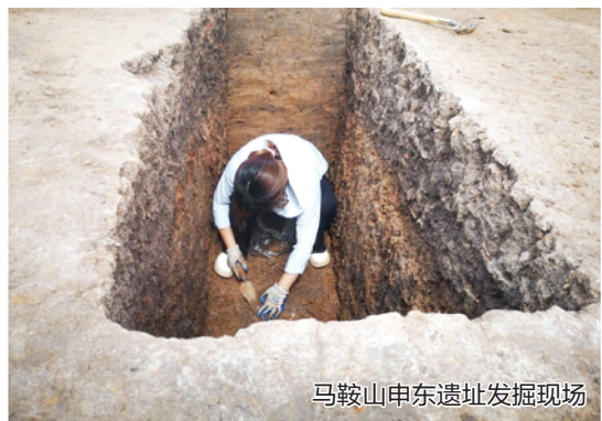
马鞍山申东遗址发掘现场