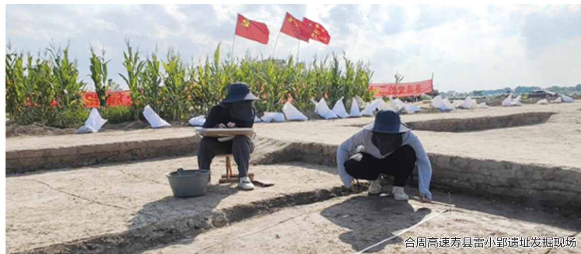
合周高速寿县雷小郢遗址发掘现场