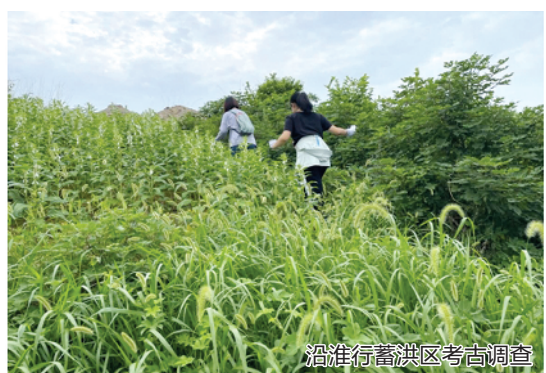
沿淮行蓄洪区考古调查