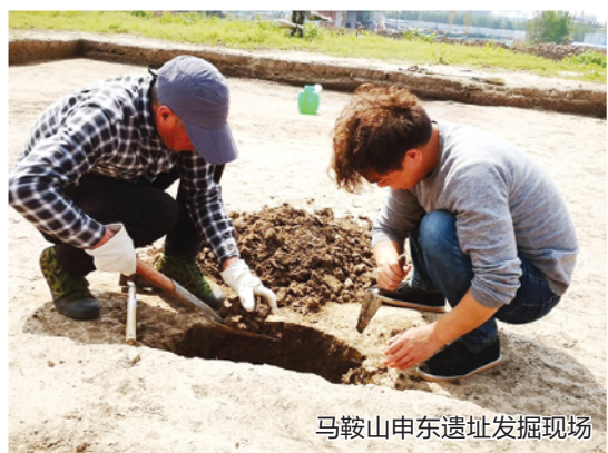
马鞍山申东遗址发掘现场