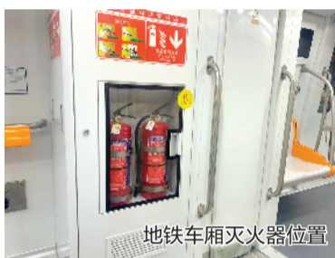
地铁车厢灭火器位置

近期，国内某城市地铁发生惊险一幕——列车上一名乘客的充电宝突然发生自燃，一时间车厢内浓烟弥漫……虽然现场火势很快被控制，未造成人员伤亡，但该趟列车随后退出运营服务。充电宝能带上地铁吗？如果能带需要注意些什么？10月16日，合肥市轨道集团发布了相关注意事项。