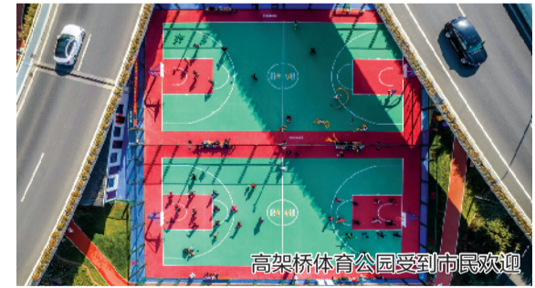
高架桥体育公园受到市民欢迎

聚焦片区更新，瑶海区2024年将加快和平片区更新，适时启动其余片区更新，努力把每个片区都打造成定位明确、特色突出的城市更新典范。聚焦空间拓展，加快推动专业市场搬迁改造，系统梳理闲置土地和低效土地，力争全年上市土地超700亩，持续提升土地综合使用效率。