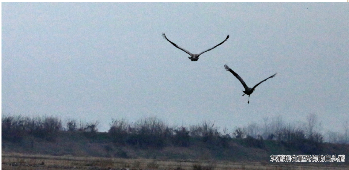
灰鹤和右腿受伤的白头鹤