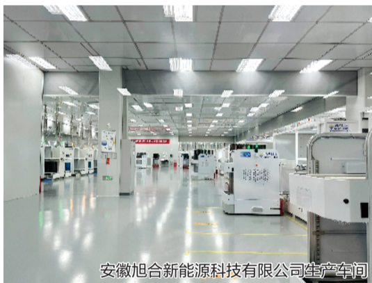
安徽旭合新能源科技有限公司生产车间

聚焦打造“一二三城”目标，滁州抢抓新机遇、跨上新赛道、壮大新动能。去年1—11月，全市“新三样”出口45.9亿元、居全省第二。其中，先进光伏和新型储能产业规模从无到有、从小到大，产值连续两年实现翻番，去年产值达1362亿、增长56%，连续3年举办全国光伏行业大会（论坛），全球光伏20强企业有9家落户滁州，光伏玻璃、电池片、组件产能均占全省一半以上；动力电池产业集聚了比亚迪、国轩、力神、天合等一批头部企业，产值增长超25%；新能源汽车产业规上企业达483家、居全省第三。