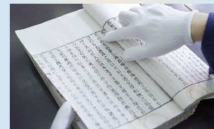
《桐城桂林方氏家谱》记录桂林方氏由来