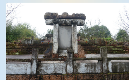
枞阳浮山方以智墓