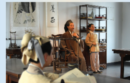
好学是方氏优良家风之一