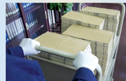
省图馆藏《桐城桂林方氏家谱》