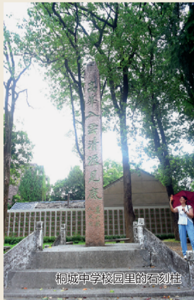
桐城中学校园里的有刻柱

2022年，为庆祝桐城中学建校120周年，桐城中学1983届校友发起校训“勉成国器”雕刻版搭载活动，经桐城中学申请、中国载人航天工程办公室批准，校训以邮票雕刻版的特殊艺术形式，由神舟十四号飞船搭载运往中国空间站。2022年6月5日上午10:44，这张雕刻版搭乘神舟十四号载人飞船前往中国空间站，开始太空之旅；2022年10月，中国首位女航天员、神舟十四号航天员乘组成员刘洋在中国空间站展示桐城中学校训，以庆祝桐城中学建校120周年；2022年12月4日晚20:09，雕刻版随神舟十四号载人飞船返回舱着陆回收并运至中国空间技术研究院，并经北京方圆公证处公证。