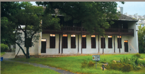
“半山阁”：曾经的藏书楼，现在的吴汝纶纪念馆