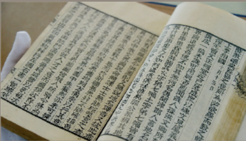
桐城市图书馆珍藏《桐城吴先生尺牍》

漫步桐中，气韵娴雅。校园内的石刻柱、后乐亭、院士长廊、桐溪埭……无不展示着这座中学历史的悠久、文化底蕴的深厚。