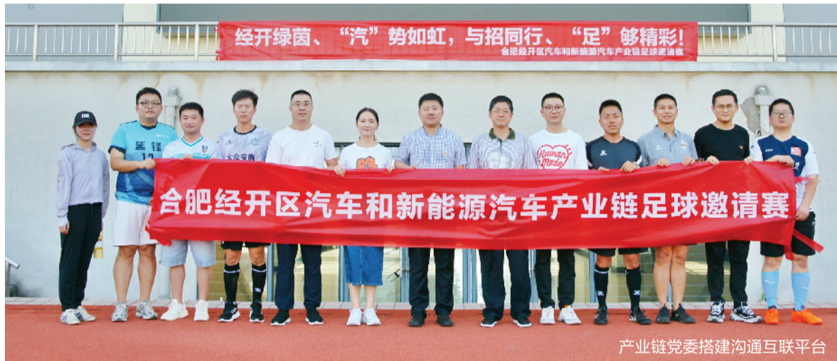
产业链党委搭建沟通互联平台

9月27日上午,在合肥经开区芙蓉社区,合肥市首个饿了么蓝骑士驿站流动党员党支部正式成立,每天辛勤工作的外卖小哥们也有了属于自己的“娘家”,是该区新业态、新就业群体党建工作的新进展。从传统制造业到战新产业,从商圈到园区,从产业链到发展链,合肥经开区坚持党建引领,持续探索“党建惠企”新思路、新路径,联动多方资源要素服务企业,着力构建“党建稳企、党建惠企、党建兴企”工作格局,推动“党建红”与“产业蓝”双向奔赴,为“先进制造业集聚区”“改革开放新高地”夯实高质量发展的基础。