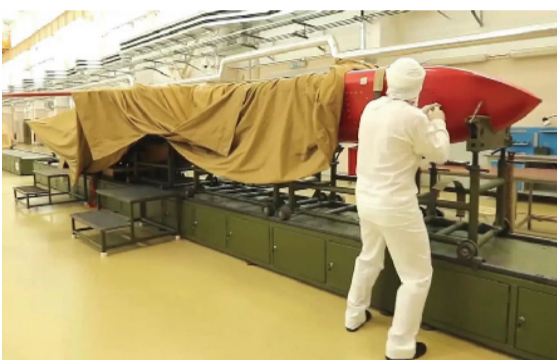
△俄国防部展示在总装车间的“海燕”核动力巡航导弹

“海燕”核动力巡航导弹成熟后，会成为俄罗斯战略核武库中的新成员。俄方大概率不会在特别军事行动中“海燕”，但可通过发布测试数据、公开展示等方式，震慑美国和其他北约成员国。俄罗斯也可将“海燕”作为撬动俄美关于《新削减战略武器条约》延期的谈判的重要工具之一。